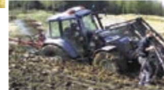
Lukijoiden omat kuvat, arvostettu osasto!